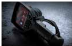
国内フルメンテナンス