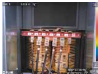
デジタルカメラモード

MSX®機能(スーパーファインコントラスト機能)は、リアルタイムで画像を補正することができ、構造物の詳細や発熱箇所の判別が熱画像上で容易に行えます。また、デジタルカメラモードとの同時撮影も可能で、同画角の可視画像を簡単に生成することができます。