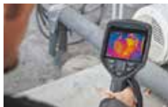
高視野角 高輝度IPS液晶