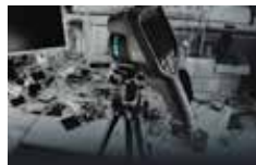
タイムラプス撮影 (E95)