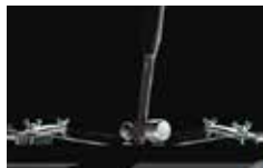
カバーガラスにDragontrail®採用