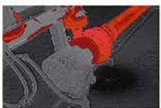
閾値設定機能 カラーアラーム機能