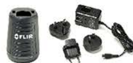
充電器 (ACアダプタ付) ¥30,000