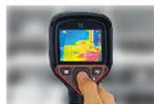
片手で全ての操作が可能