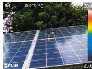
デジタルカメラモード

MSX®機能(スーパーファインコントラスト機能)は、リアルタイムで画像を補正することができ、構造物の詳細や発熱箇所の判別が熱画像上で容易に行えます。また、デジタルカメラモードとの同時撮影も可能で、同画角の可視画像を簡単に生成することができます。