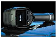
国内フルメンテナンス