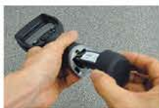
リプレーサブルバッテリー